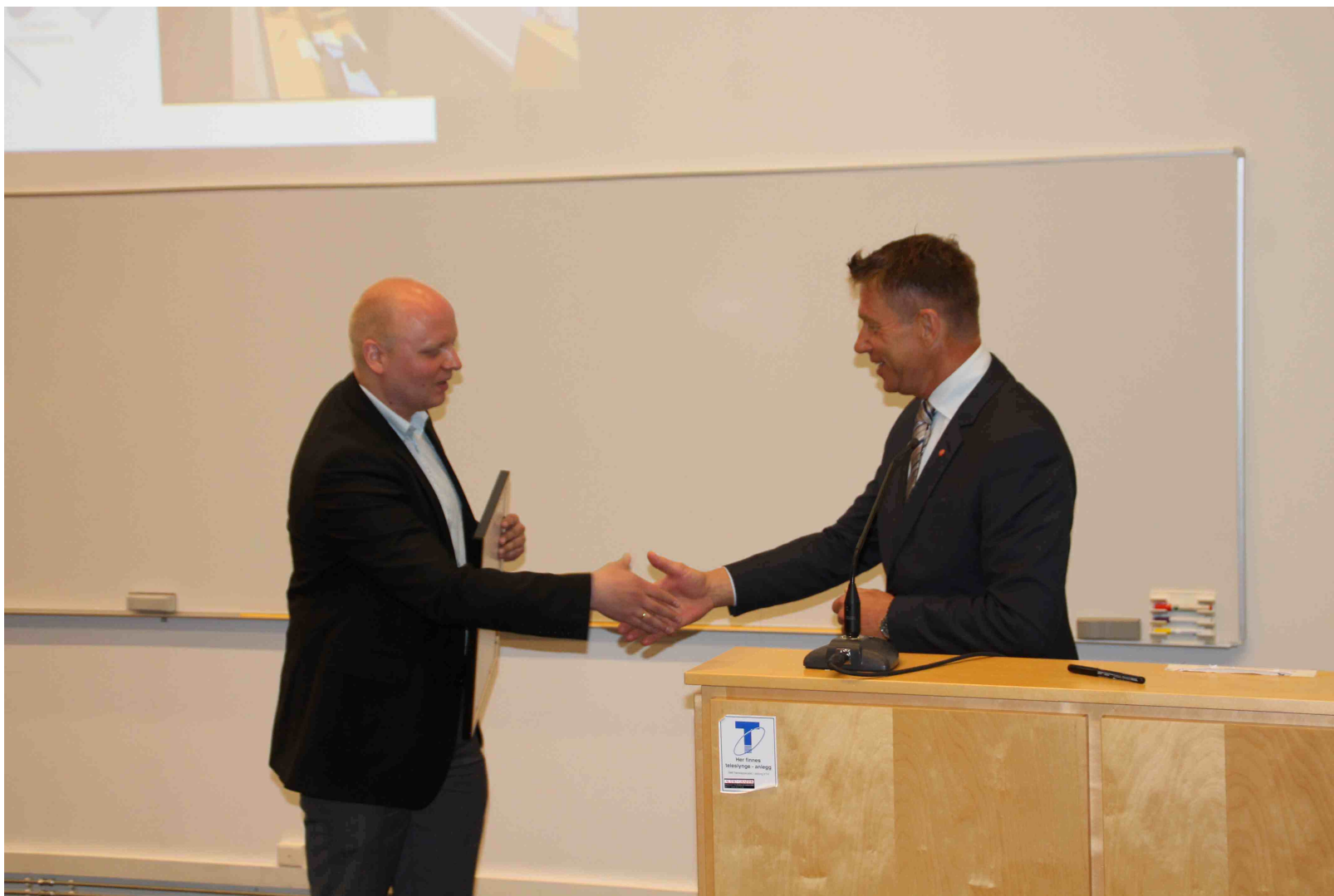
Utdeling av Norecopas 3R-pris på kr. 30.000 Adamstua, Oslo