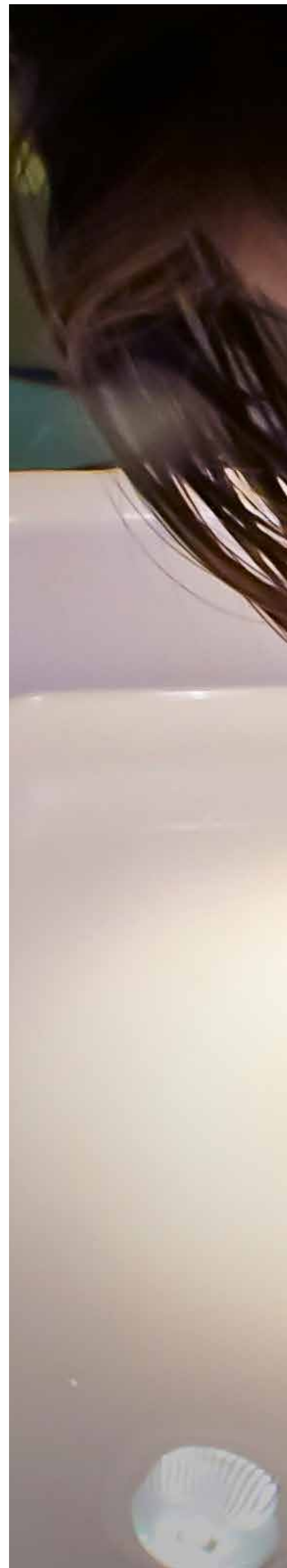
Forsøksdyr: I kampen mot for eksempel