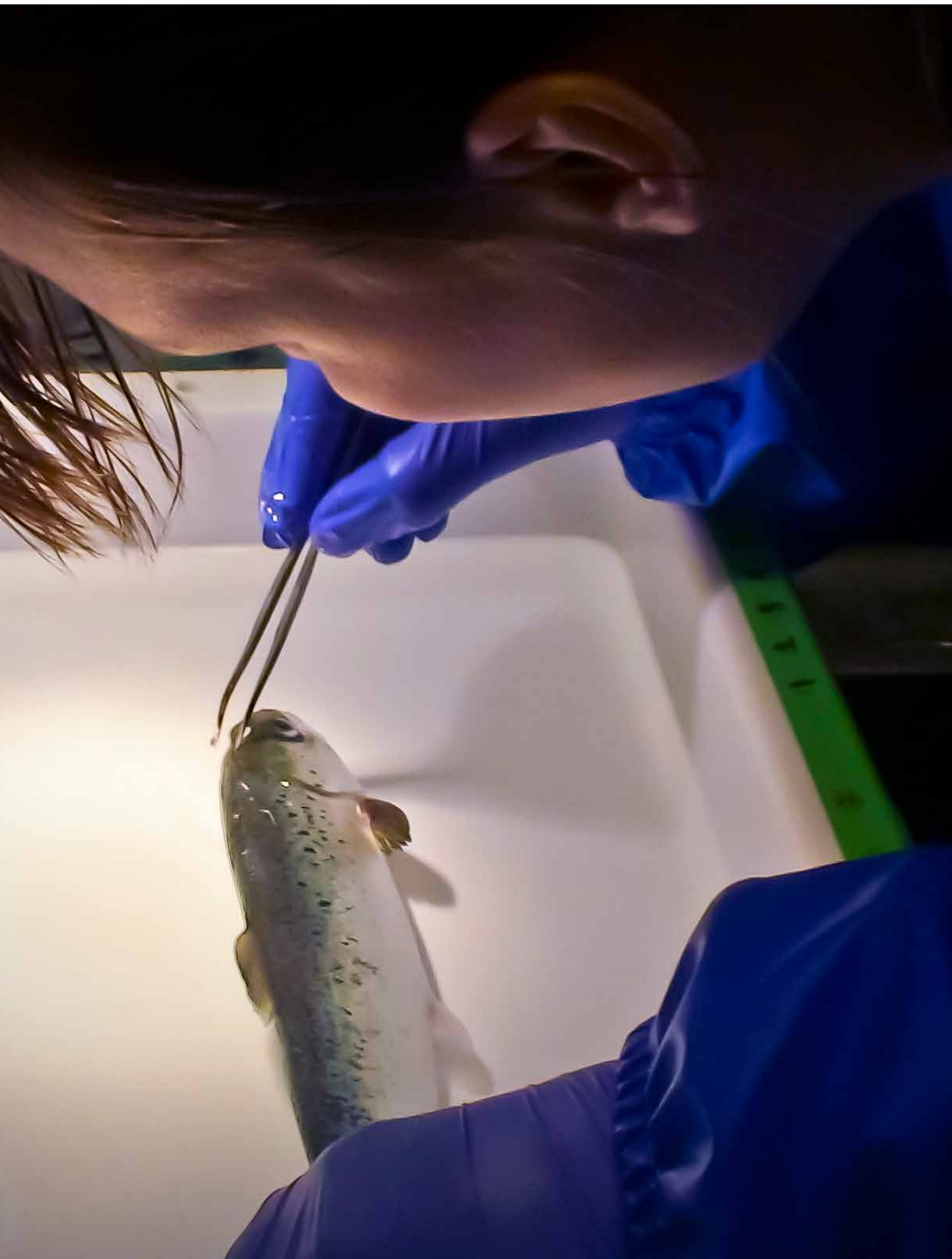
lakselus brukes et stort antall forsøksdyr, noe som bringer Norge opp i Europa-toppen. III.